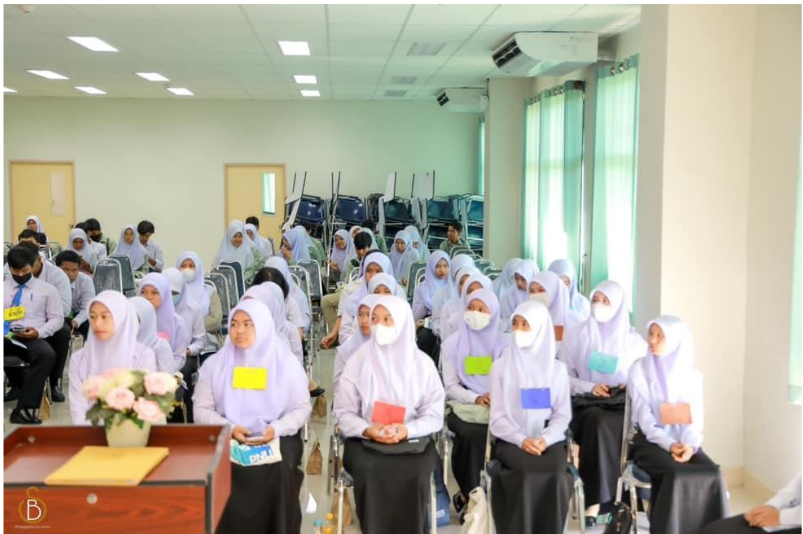
บรรยากาศในโครงการการปฐมนิเทศและประชุมผู้ปกครองนักศึกษาใหม่ ปีการศึกษา 2566