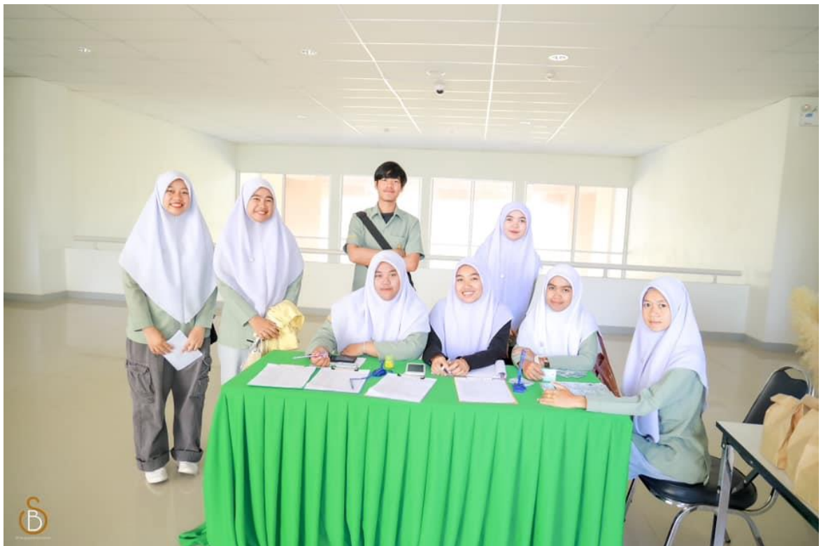
บรรยากาศในโครงการปฐมนิเทศและประชุมผู้ปกครองนักศึกษาใหม่ ปีการศึกษา 2566