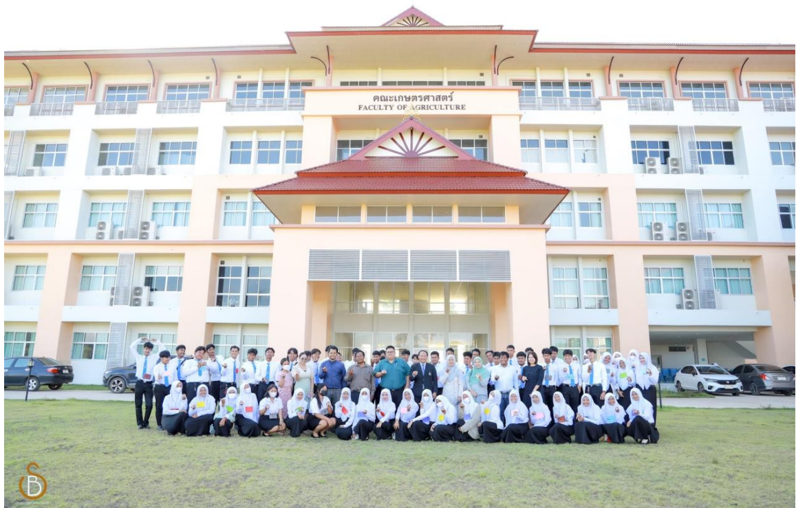
ร่วมถ่ายภาพเสร็จสิ้นโครงการปฐมนิเทศและประชุมผู้ปกครองนักศึกษาใหม่ ปีการศึกษา 2566